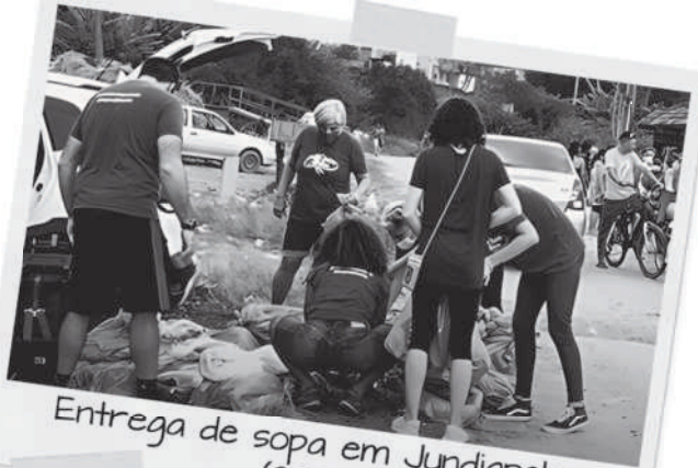
Entrega de sopa em Jundiapéba (2022)