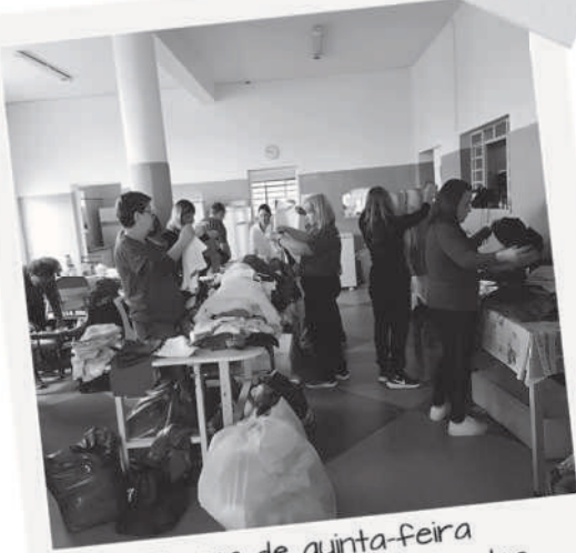
Turma de quinta-feira separando roupas e calçados para doação (2023)