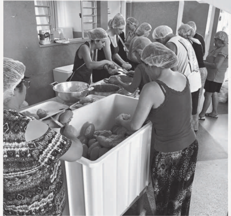
Preparação para o evento do Dia das Crianças (2023)