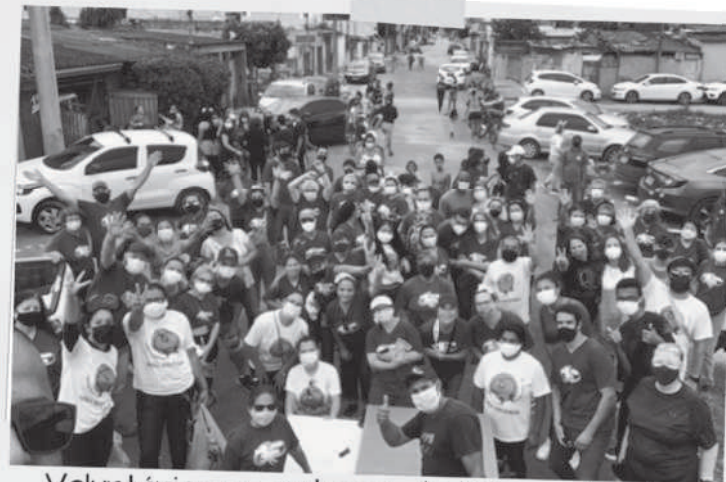
Voluntários na entrega de brinquedos da Dia das Crianças (2021)