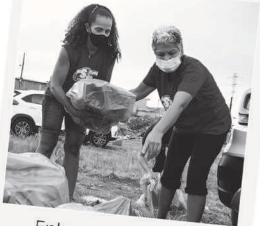
Entrega de sopa em Jundiapéba (2022)