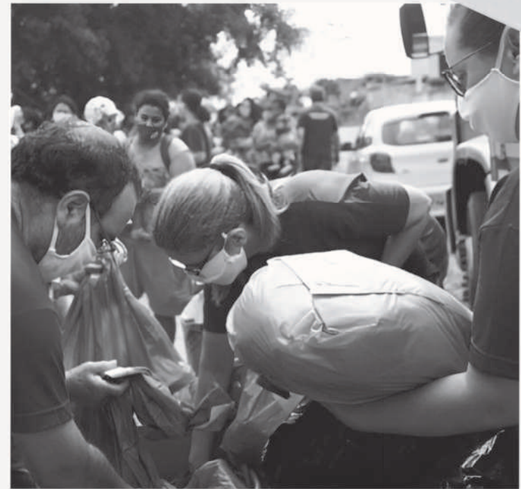
Entrega de sopa (2020)