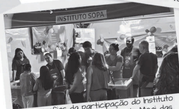
Fotografias da participação do Instituto S.O.P.A. na Festa do Divino de Mogi das Cruzes (2024)