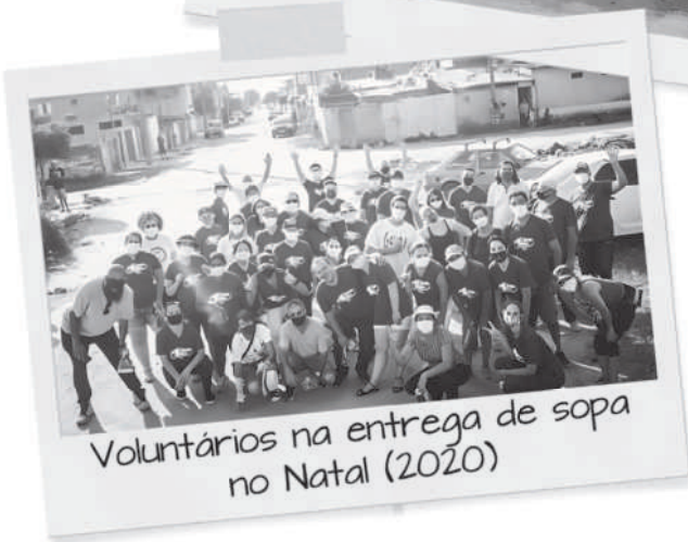
Voluntários na entrega de sopa no Natal (2020)