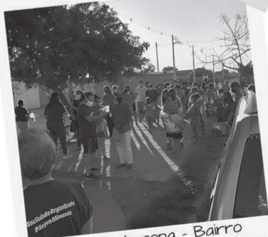
Entrega de sopa - Bairro Jardim Aeroporto de Mogi das Cruzes-SP (2020)