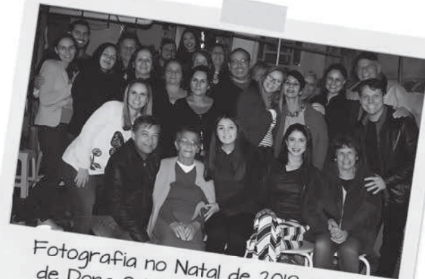
Fotografia no Natal de 2018, na casa de Dona Odette, com os voluntários