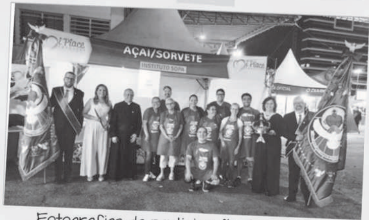
Fotografias da participação do Instituto S.O.P.A. na Festa do Divino de Mogi das Cruzes (2024)