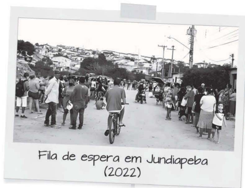
Fila de espera em Jundiapéba (2022)