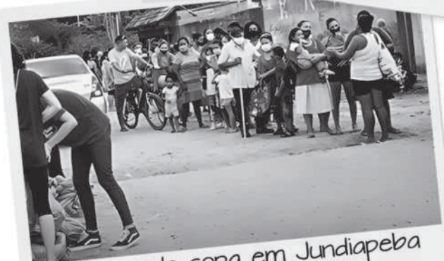
Entrega de sopa em Jundiapéba (2022)